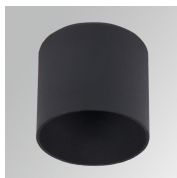
Cód. producto: HSCU50 Descripción: HANCE 1000/2000 ACC. CUTTING BEAM