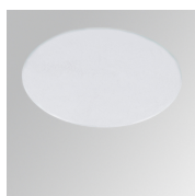
Cód. producto: HSSL50 Descripción: HANCE 1000/2000 ACC. SOFT LENS