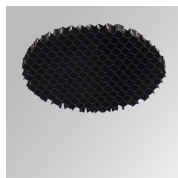
Cód. producto: HSHO50 Descripción: HANCE 1000/2000 ACC. HONEYCOMB GRILLE