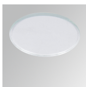
Cód. producto: HSTR50 Descripción: HANCE 1000/2000 ACC. DIF TRANS