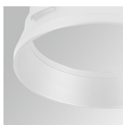
Cód. producto: HSRI65W Descripción: HANCE 1000/2000 ACC. RING DECO WH.