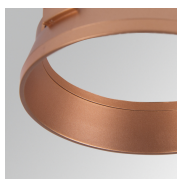
Cód. producto: HSRI65C Descripción: HANCE 1000/2000 ACC. RING DECO CO.