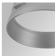
Cód. producto: HSRI65M Descripción: HANCE 1000/2000 ACC. RING DECO MET.